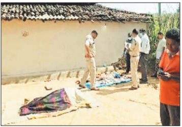
घटना स्थल पर जांच करती पुलिस, दम्पति का शव।

घर में सो रहे बुजुर्ग दम्पति की बेरहमी से हत्या का मामला सामने आया है। दम्पति का शव उनके घर में बिस्तर पर मिला है। इस घटना से क्षेत्र में सनसनी फैल गई है। संभावना जताई जा रही है कि किसी भारी वस्तु से सिर पर वार कर दोनों की हत्या की गई है। इस घटना की सूचना मिलने के बाद मौके पर पहुंची पुलिस ने शवों को पीएम उपरान्त परिजन के सुपुर्द कर दिया है और मामले की जांच चल रही है। निःसंतान दम्पति की हत्या के कारणों का फिलहाल पता नहीं चल सका है लेकिन हत्यारों ने इसे चोरी की घटना का रूप देने का प्रयास किया है।