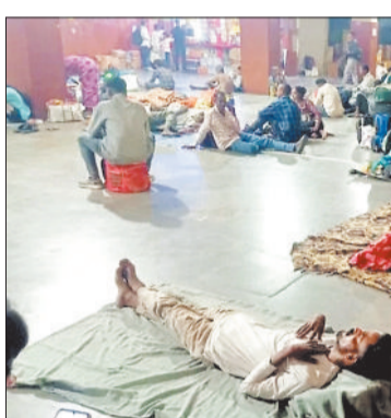
ओवरटाइम व्यवस्था समाप्त हो जाएगी। इससे न केवल मजदूरों की आय पर असर पड़ेगा, बल्कि बेरोजगारी की समस्या भी और बढ़ेगी। पूर्व व्यवस्था के तहत मजदूर प्रतिदिन 8 घंटे की तीन शिफ्टों में काम करते थे, जिससे रोजगार के

इसी कड़ी में सुंदरगढ़ औद्योगिक क्षेत्र मजदूर संघ का ओर से बुधवार को फैक्ट्री इंपेक्टर कार्यालय के समक्ष विरोध प्रदर्शन किया गया। इस आंदोलन में बड़ी संख्या में मजदूर शामिल हुए। संघ ने स्पष्ट कहा कि नया नियम मजदूरों के अधिकारों का हनन है और इसके लागू होने से प्रस्तावित नियम के खिलाफ मजदूरों ने संगठनों ने मोर्चा खोल दिया है।